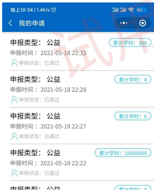
图 16 公益学时详情界面