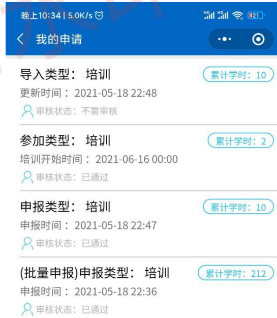
图 17 培训学时详情界面