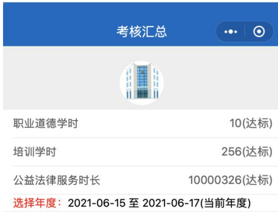
图 14 考核汇总界面

本模块是汇总律所每个年度的职业道德学时、培训学时、公益法律服务时长，并给出对应的达标情况。如图 14 所示。律师可以点击学时数查看对应学时的详细加分情况。如图 15、16、17 所示。律师还可以修改当前年度，查看其他年度的成绩单。如图 18 所示。