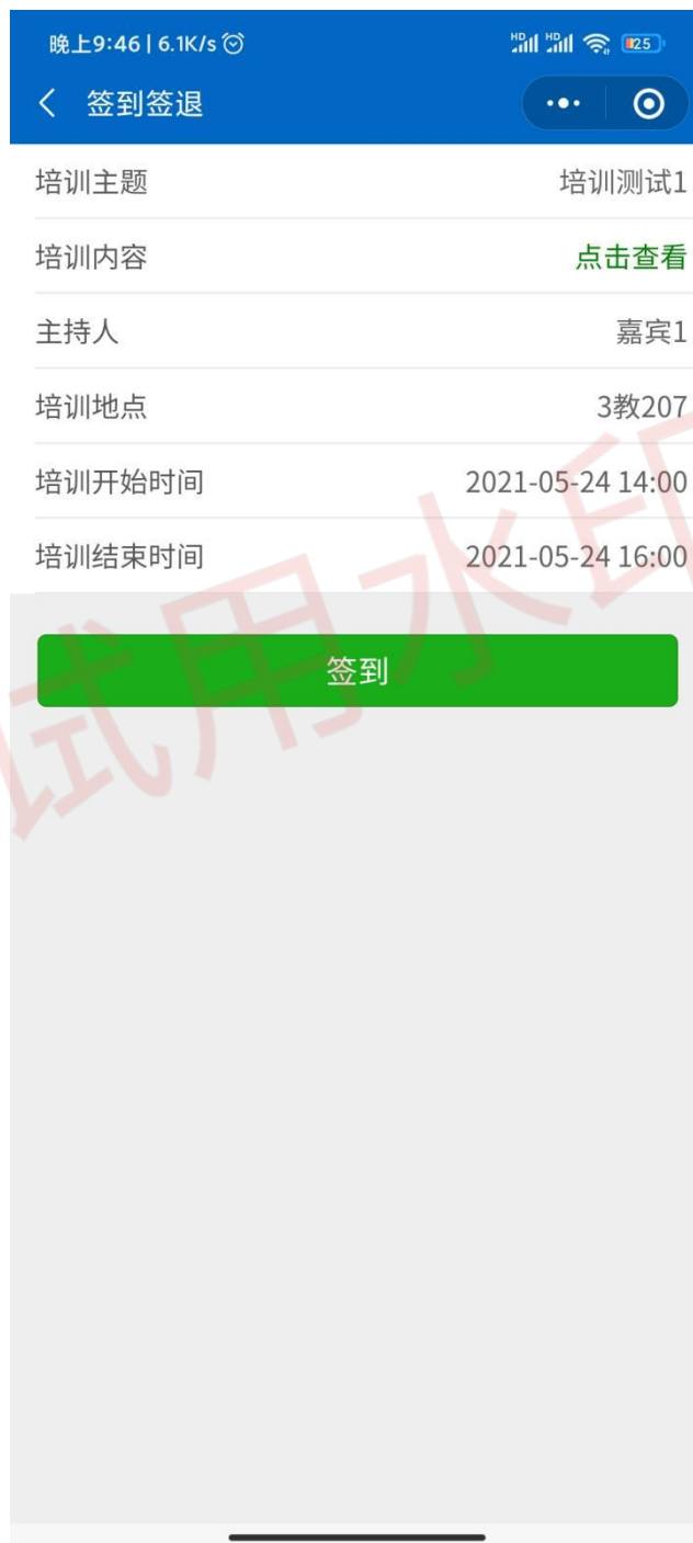
图 3 扫码签到界面展示