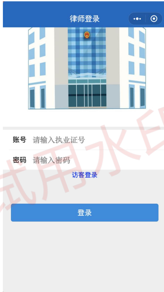
图 1 用户登入界面展示

打开系统即进入用户登入界面，正确输入用户名和密码后，点击登录按钮即可进入首页。如图 1 所示。