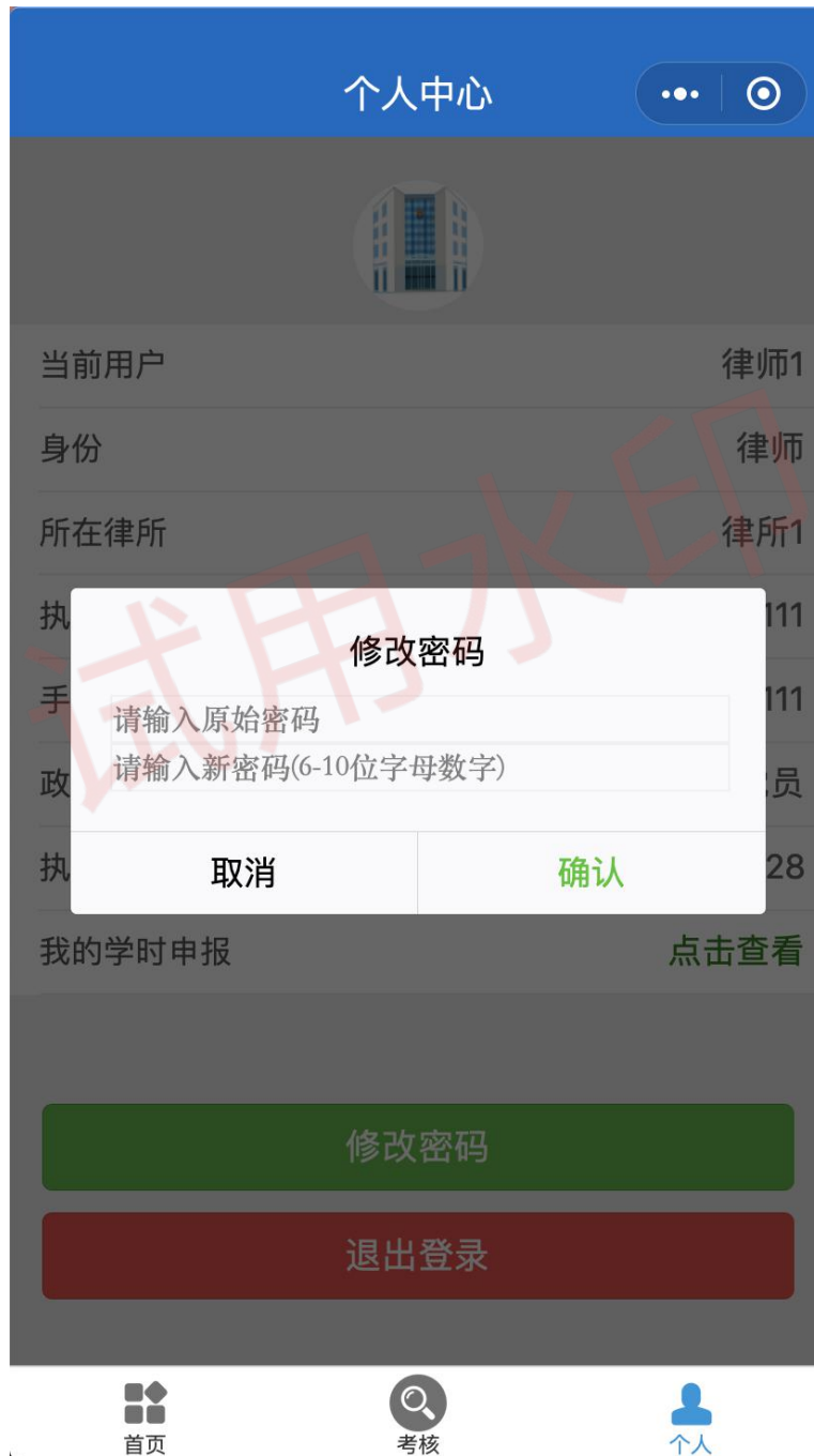
图 24 修改密码界面

修改密码入口存放在个人中心首页，点击即弹出修改密码弹窗。如图 24 所示。在弹窗中填写原始密码和新密码即可修改密码。