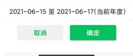
图 18 选择年度