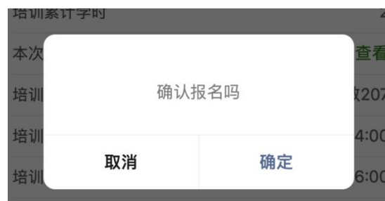
图 7 报名弹窗