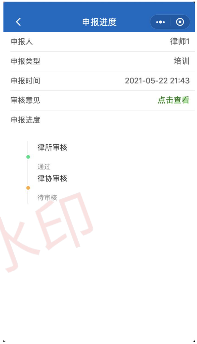
图 22 申报进度详情页

审核意见为点击“点击查看”按钮的形式查看。如申请被驳回，将会有审核意见。如图 23 所示。