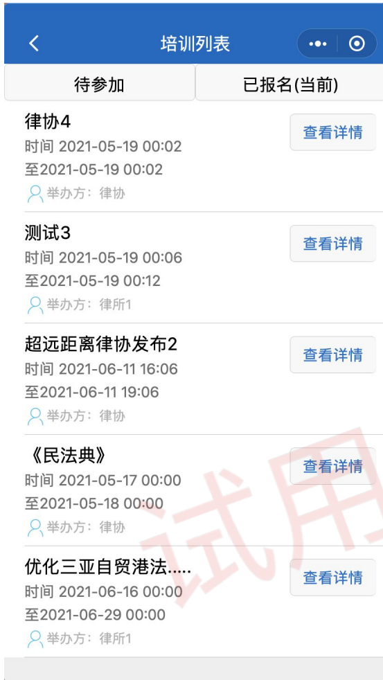
图 8 已报名培训列表

已报名报名列表会展示所有的已报名的培训。可以点击查看详情，查看对应的培训的详细信息。如图 8 所示。培训详细信息里与未报名的培训界面中不同的是下方的状态会改为“已报名”。如图 9 所示。