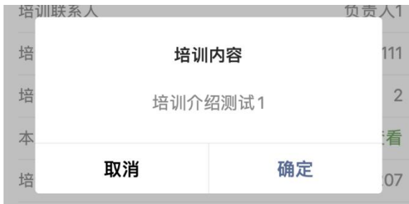
图 6 点击查看部分