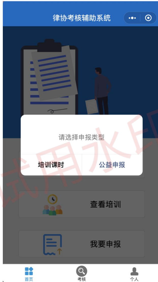
图 10 我要申报界面展示