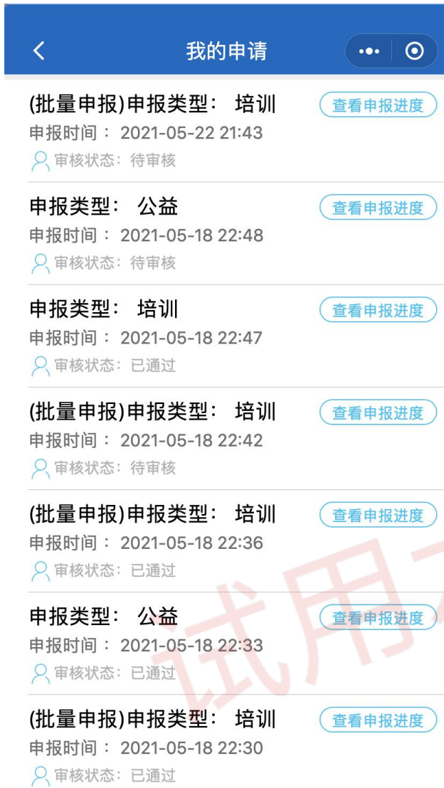
图 21 学时申报记录界面