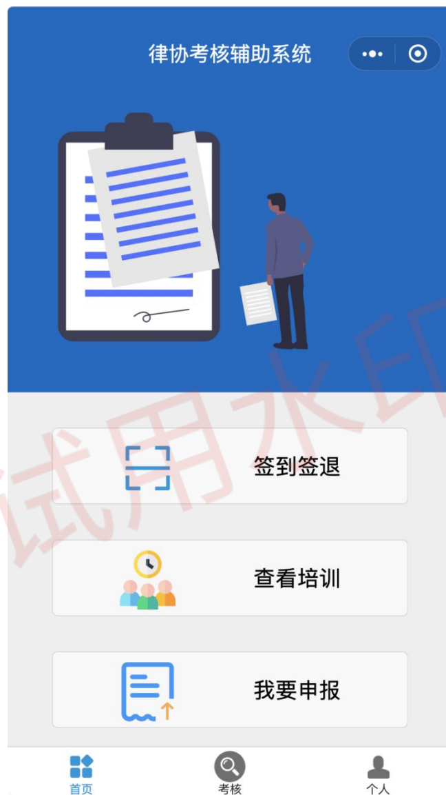
图 2 首页界面展示

如下图 2 所示，首页共分为 2 个区域。从上到下，依次为菜单栏和底部菜单导航栏。分别有签到签退、查看培训、我要申报以及首页、考核、个人中心。