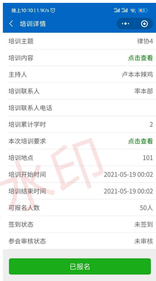
图 9 已报名培训详细信息