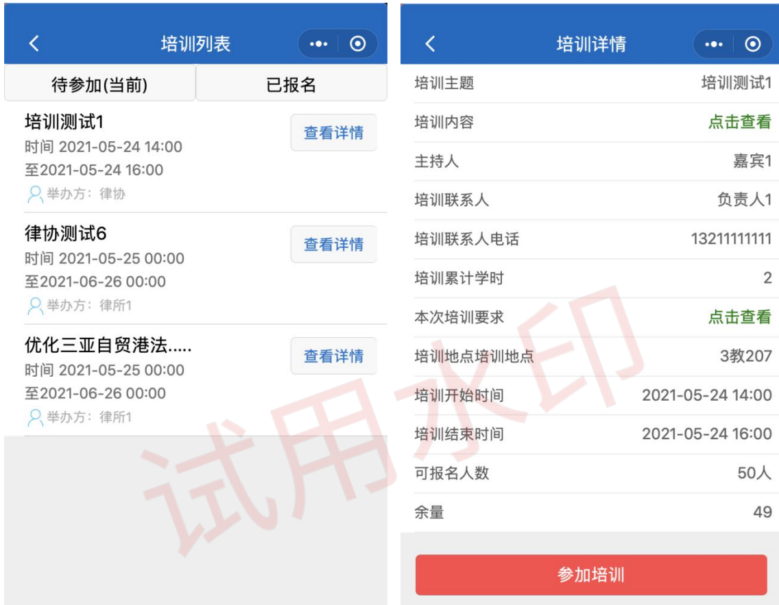
图 4、图 5 培训界面展示

该待参加界面可以查看目前系统中所有公开的、未结束的培训。如图 4 所示。点击查看详情可以查看该条培训的详情。如图 5 所示。