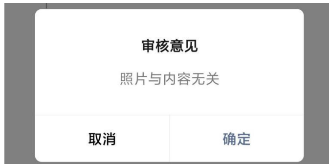
图 23 审核意见界面

审核意见为点击“点击查看”按钮的形式查看。如申请被驳回，将会有审核意见。如图 23 所示。