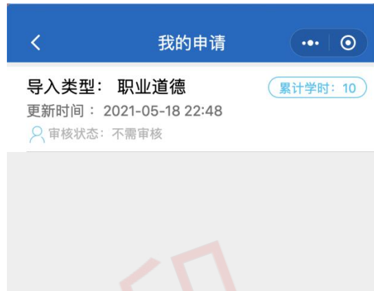
图 15 职业道德详情